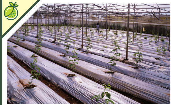
Tiêu chuẩn cơ sở vật chất