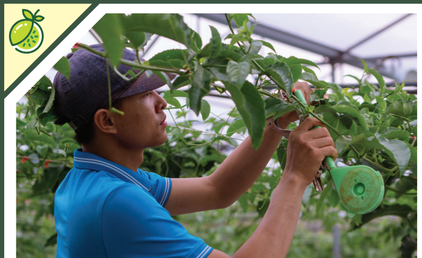
Tiêu chuẩn đội ngũ và tư duy vận hành