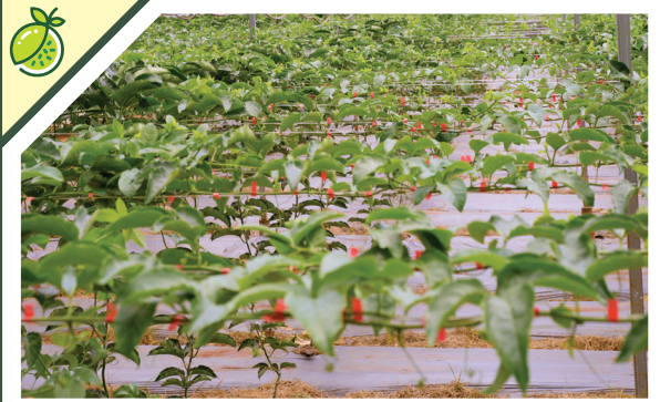
Tiêu chuẩn sản phẩm

Chúng tôi xây dựng bằng hệ thống vận hành và 5 bộ tiêu chuẩn cốt lõi.